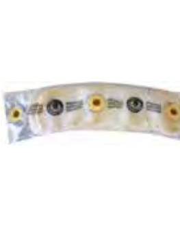
UDANG-MAS Krabbenbrot lang 荷蘭長蝦片 24 x 60 g