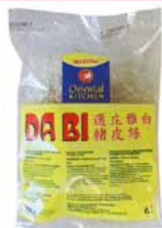
ORIENTAL KITCHEN Schweineschwarte in Streifen Da Bi 萬興選庄雅白豬皮絲 50 x 100 g