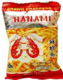
HANAMI Krabben-Cracker 泰國鮮蝦條 120 x 15 g