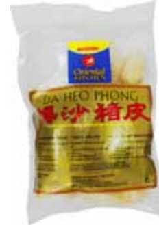
ORIENTAL KITCHEN Schweineschwarte Da Heo 萬興爆沙豬皮 50 x 50 g