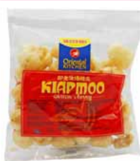
ORIENTAL KITCHEN Schweineschwarte Kiap Moo 萬興即食油爆豬皮 50 x 50 g