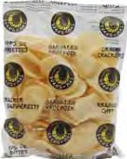
UDANG-MAS Krabbenchips rund 荷蘭圓蝦片 24 x 80 g