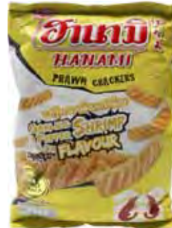
HANAMI Krabben-Cracker Knoblauch/Pfeffer 泰國蒜蓉胡椒鮮蝦條 24 x 62 g