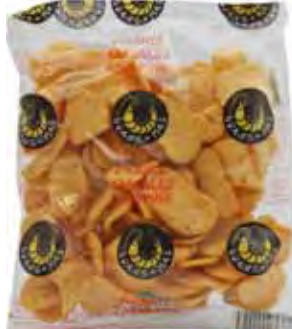
UDANG-MAS Krabbenchips rund scharf 荷蘭辣圓蝦片 24 x 80 g