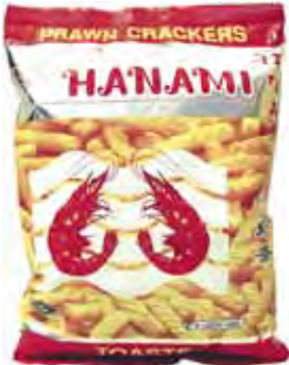
HANAMI Krabben-Cracker 泰國鮮蝦條 36 x 60 g