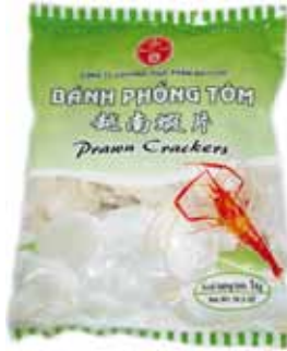
BICH-CHI Krabbenchips zum Ausbacken 越南龍蝦片 12 x 1 kg