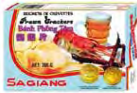
SAGIANG Krabbenchips zum Ausbacken 越南沙江龍蝦片 50 x 200 g