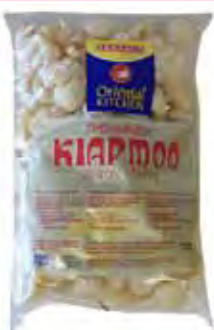
ORIENTAL KITCHEN Schweineschwarte Kiap Moo 萬興即食油爆豬皮 50 x 100 g