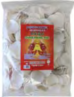
SAGIANG Krabbenchips zum Ausbacken 越南沙江龍蝦片 10 x 1 kg