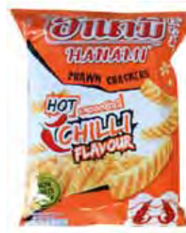
HANAMI Krabben-Cracker Chili 泰國辣椒鮮蝦條 24 x 62 g